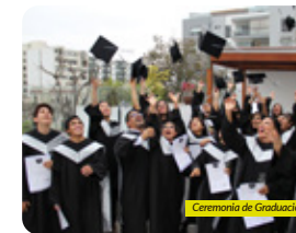
Ceremonia de Graduación