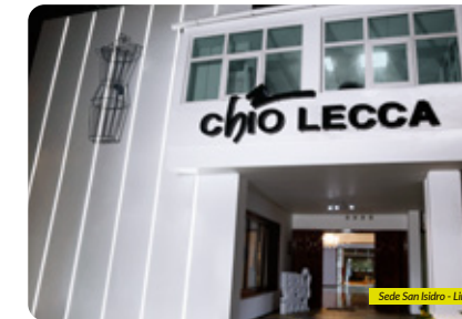
Sede San Isidro - Lima