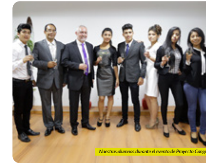
Nuestros alumnos durante el evento de Proyecto Carguro