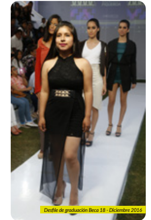
Desfile de graduación Beca 18 - Diciembre 2016