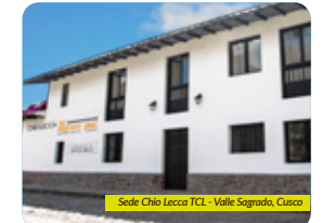
Sede Chio Lecca TCL - Valle Sagrado, Cusco